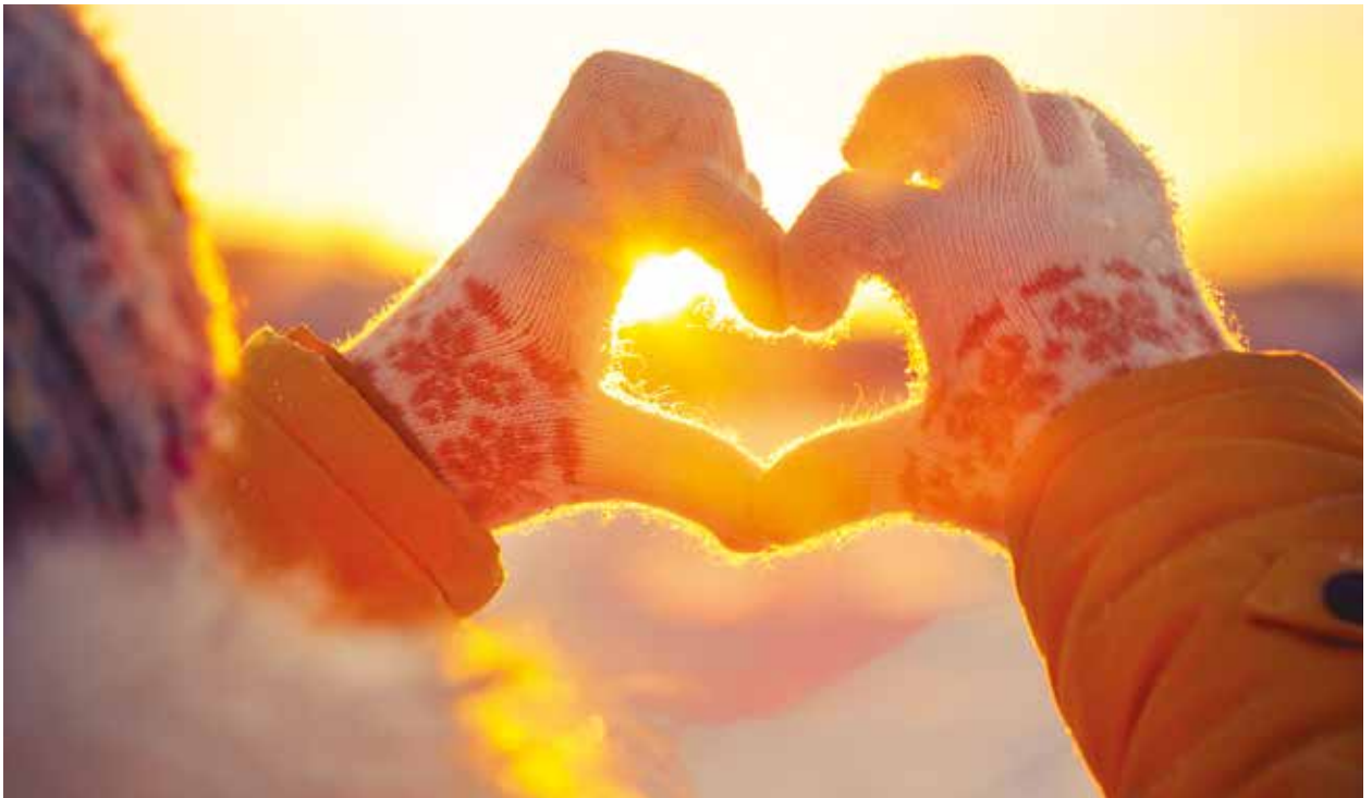
I intervjuene med ungdommene forventes det ikke en foreldrekjærlighet av de ansatte. I deres kjærlighetsforståelse er det ofte de små tegnene og det lille ekstra som var et tegn på kjærlighet i relasjonen med de ansatte.

ta med seg når man inngår i samhandlinger med omgivelsene. For ungdommene var det viktig at de opplevde reell inkludering og deltakelse i ulike samfunnsfelleskap.